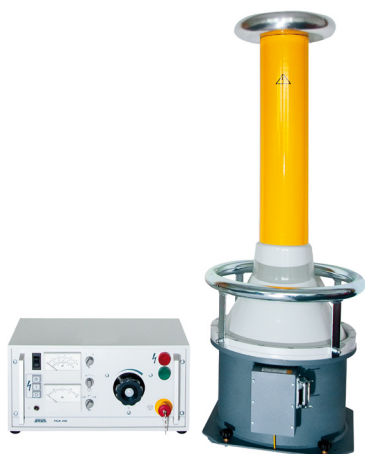
Obrázek je ilustrační.